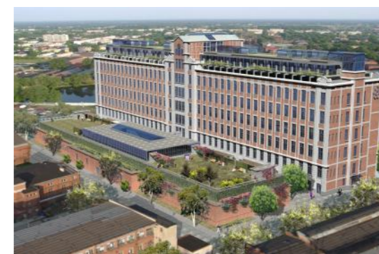
606 - 7p.